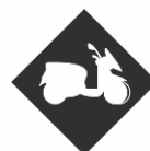
PERMIS 3 ROUES