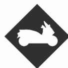
PERMIS MAXI SCOOTER